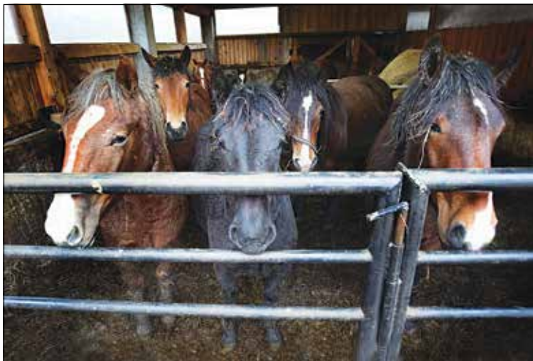
Kobile, žrebice in žrebeta v Andrejčičevem hlevu.