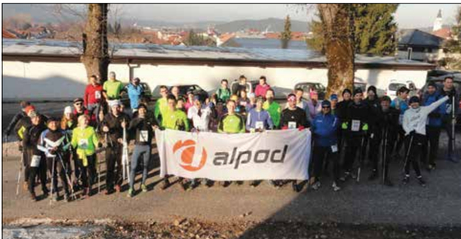
Posameznega teka Zimske tekaške lige na Slivnico se je v povprečju udeležilo 36 tekačev.

Po lanskem dobrem odzivu, ko se je tekov skupaj udeležilo 61 tekačev, se je organizator Jure Ličen odločil, da tekmovanje ponovijo tudi v sezoni 2016/2017. »Letos je tekaška liga potekala pod okriljem Športnega društva Alpod. To nam je zelo pomagalo pri organizacijski in finančni plati dogajanja,« pravi Ličen, ki je oktobra 2015 med hojo na Slivnico prišel na idejo o organizaciji zimske tekaške lige.