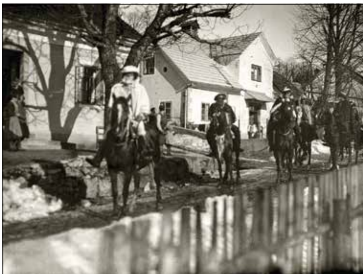
Pustni sprevod na Rakeku pred natanko 80-imi leti.

Ko so mame pekle flancate, v »močnejših hišah« pa tudi krofe, so poslale otroke na vas, kjer so žagali babo, da so imele pri peki mir in niso otroci večine pojedli še pred pustom.